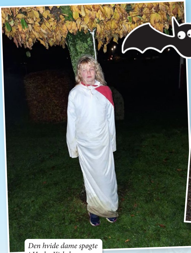
Den hvide dame spogte i Hørby Kirkeby.