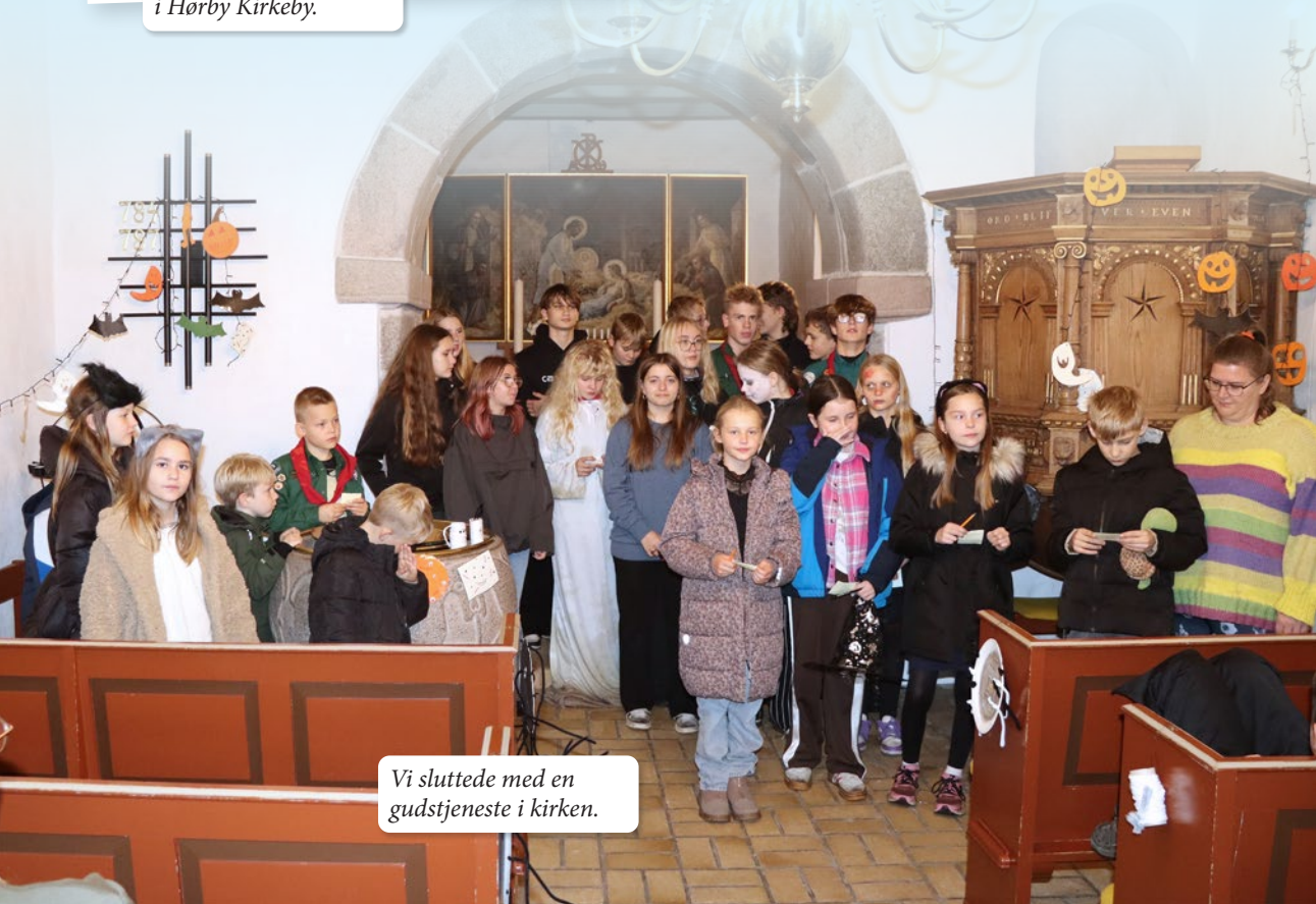
Vi sluttede med en gudstjeneste i kirken.