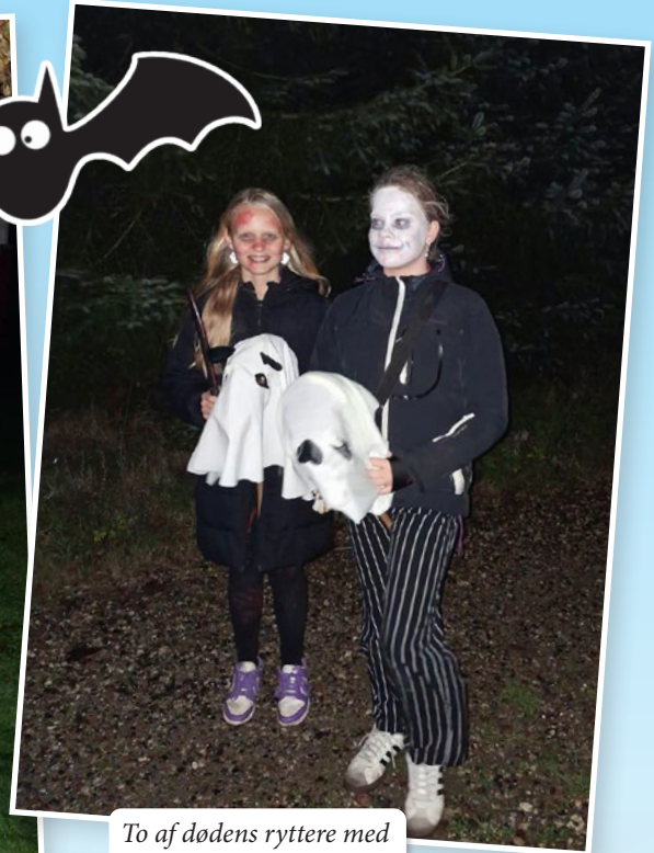
To af dødens ryttere med deres hvide gangere.