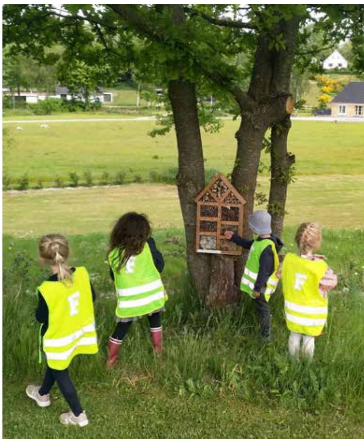
Børnene nyder synet af et af de ophængte insekthoteller, som de har lavet.