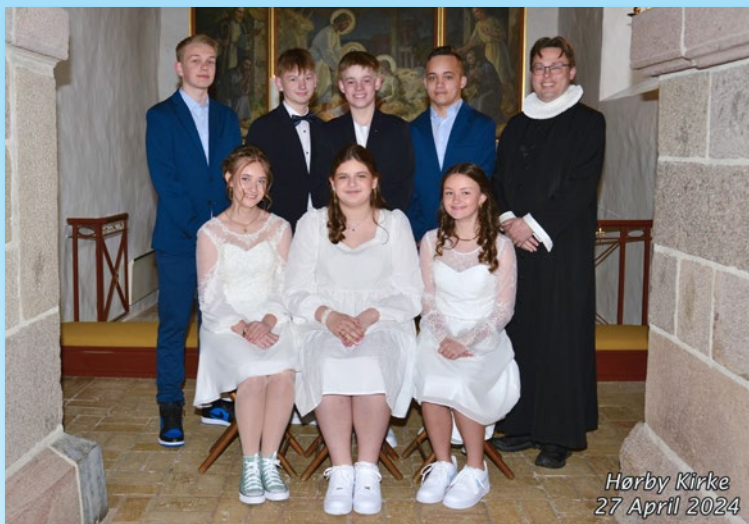
Hørby Kirke 27 April 2024

Konfirmeret lørdag d. 27. april kl. 9.00 i Hørby Kirke