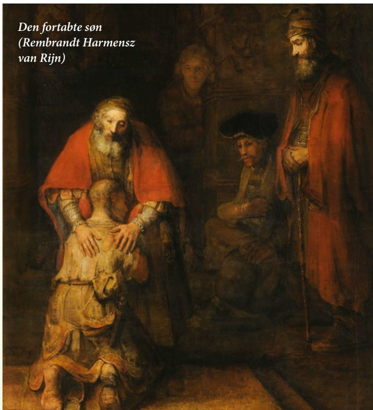
Den fortabte søn (Rembrandt Harmensz van Rijn)

Var det nu nødvendigt, at sønnen drog hjemmefra til at begynde med, når han nu alligevel endte hjemme