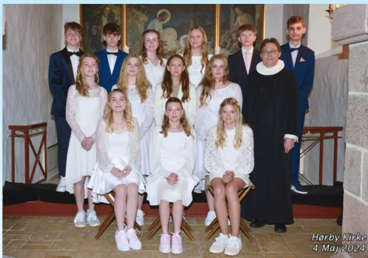
Hørby Kirke 4 Maj 2024