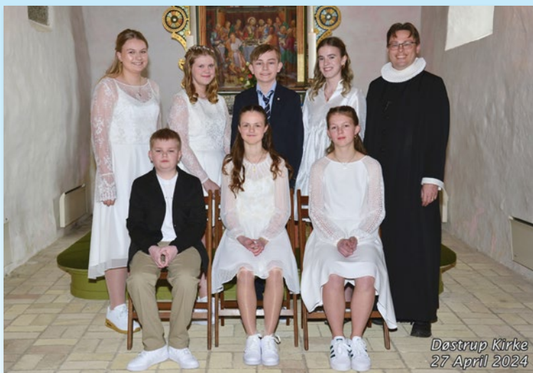
Døstrup Kirke 27 April 2024

Konfirmeret lørdag d. 4 maj kl. 9.00 i Hørby Kirke