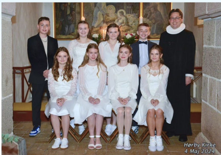
Hørby Kirke 4 Maj 2024