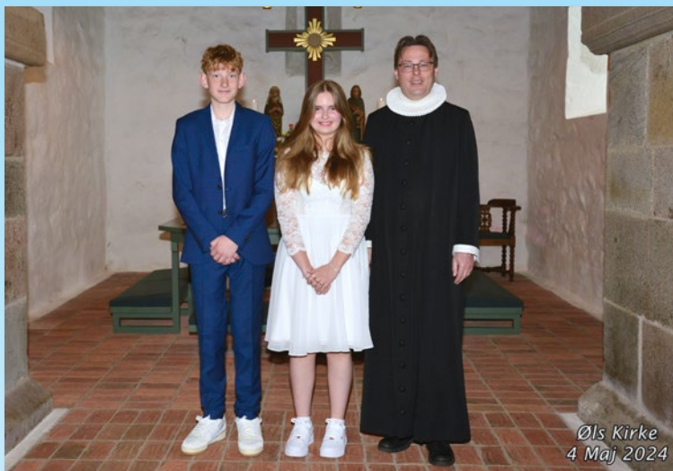
Øls Kirke 4 Maj 2024

Konfirmeret lørdag d. 4. maj kl. 10.15 i Øls Kirke